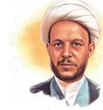
بقلم الشيخ إياد الطائي