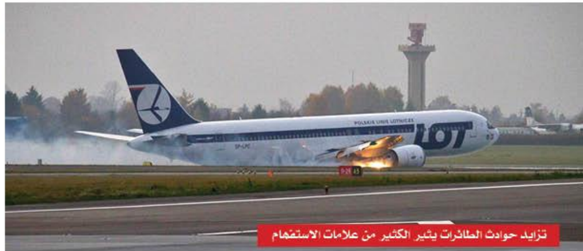
تزايد حوادث الطائرات يثير الكثير من علامات الاستفهام