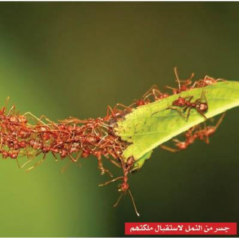
جسر من النمل لاستقبال ملكتهم