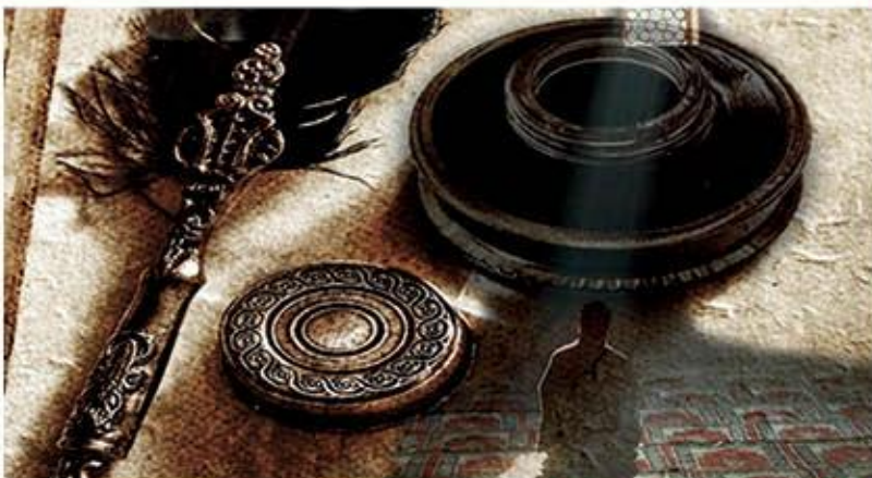
الاجتهاد ودوره في التطور العلمي والمعرفي