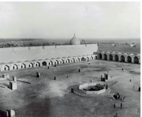
هجرة العمل الى الكوفة