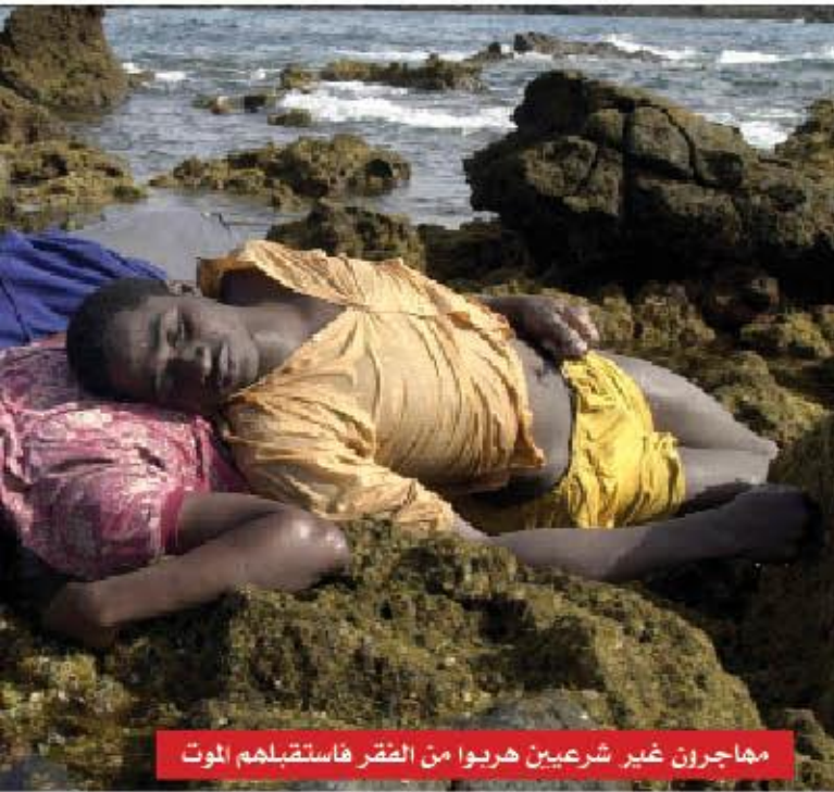
مهاجرون غير شرعيين هربوا من الضرق فاستقبلهم الموت