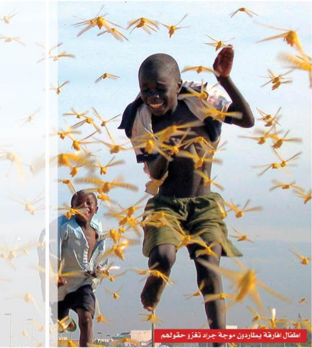
اطفال افارقة يحلادون موجة جراد تغزو حقولهم