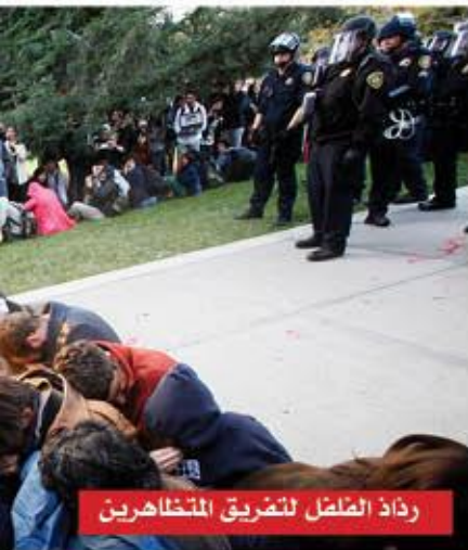
رداذ الصلصل لتفريق المتظاهرين