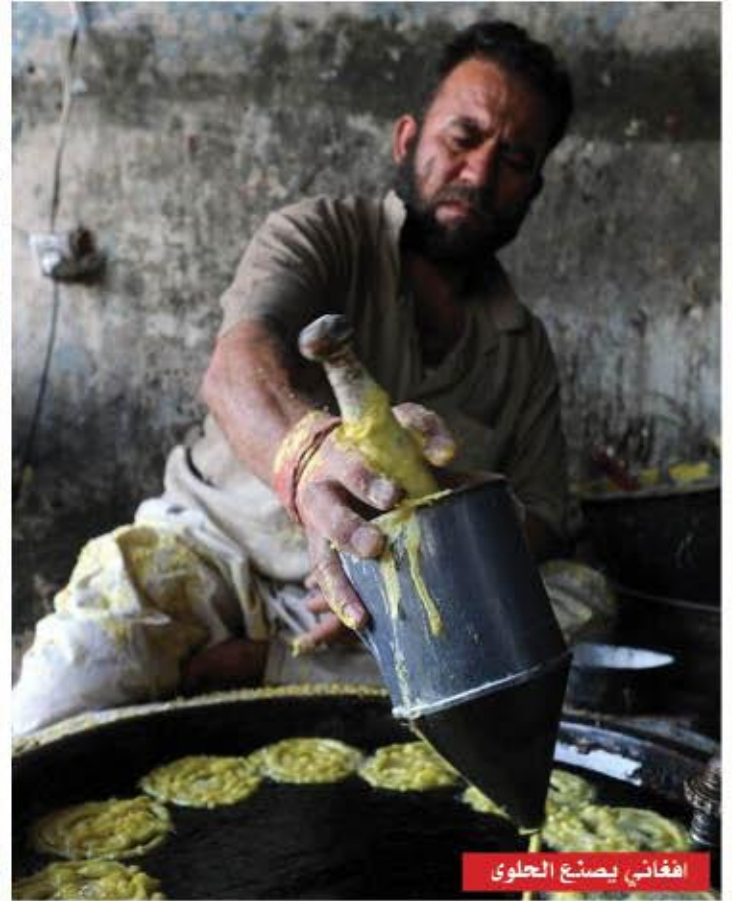
افغاني يصنع الحلوى