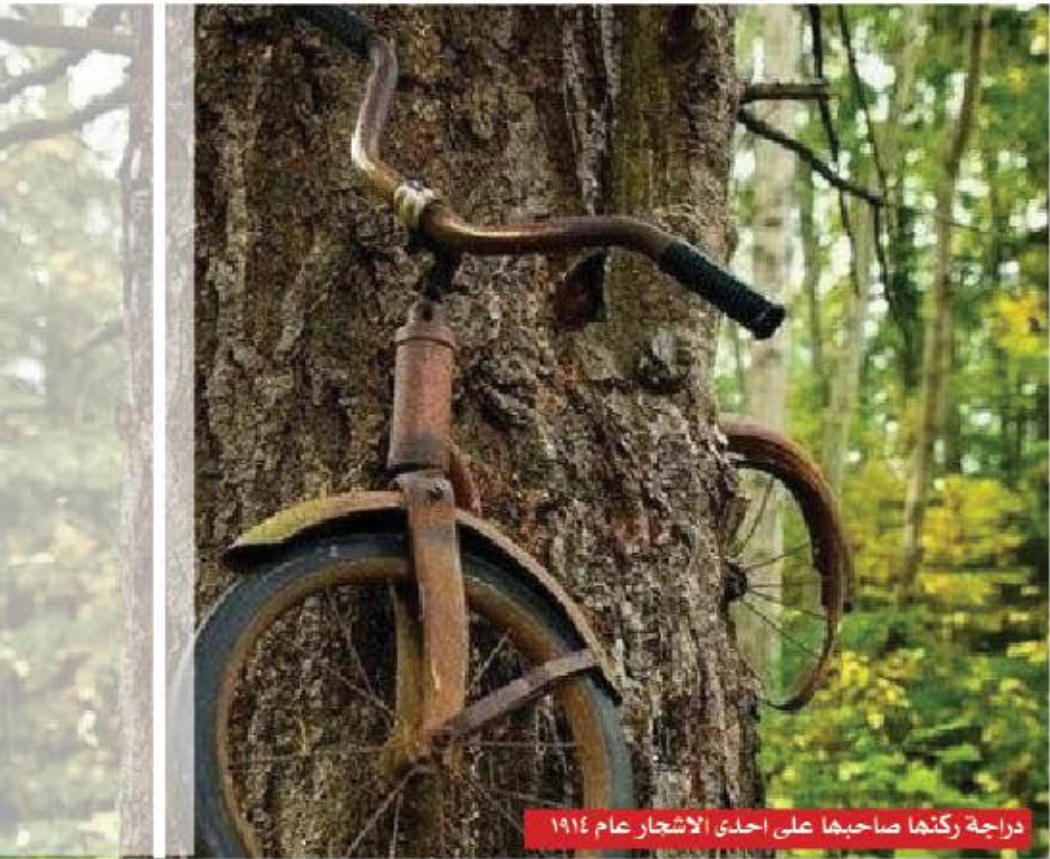
دراجة ركنما صاحبها على احدى الاشجار عام ١٩١٤