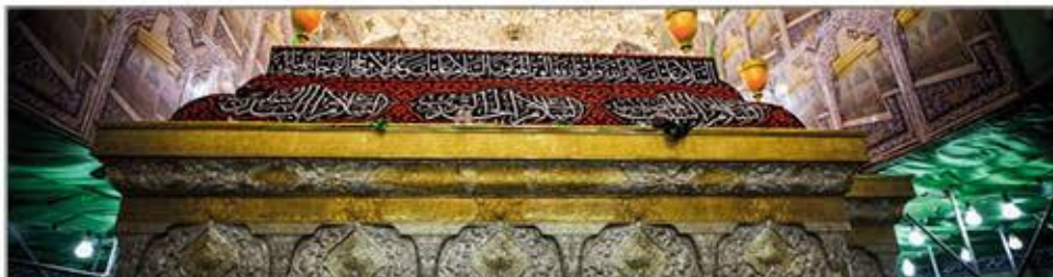
الظاهرة الحسينية.. ظاهرة تجديد واصلاح ٢٨