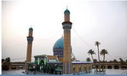
زيد بن علي.. شهيد الحقيقة ١٥