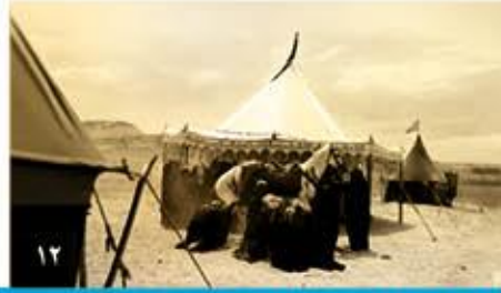
العقيلة زينب.. سيدة الصبر والمحن