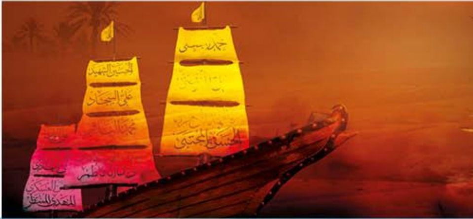
سفينة الرضوان ٢٢